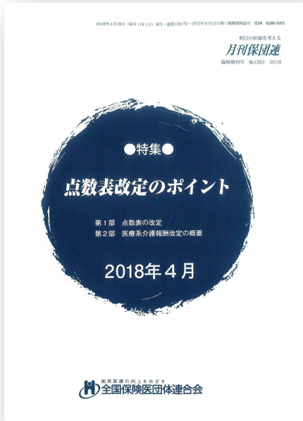
『点数表改定のポイント』 ただいま編集作業中！