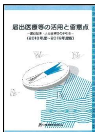
『届出医療の活用と留意点』