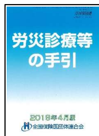
『労災診療等の手引』